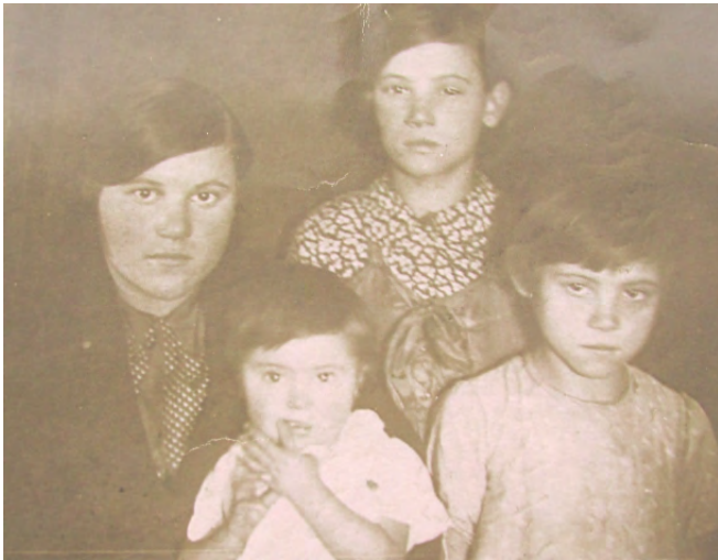
Нюкжа, 1937 г.